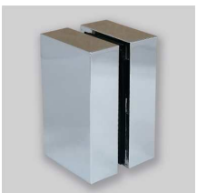
C P (クロームメッキ)