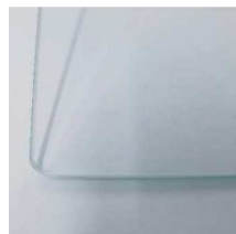
C (クリア) t=4