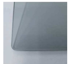
G (グレー) t=5 (特注対応)