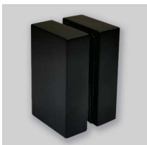
B L (ブラック)