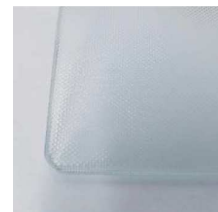
M (ミスト) t=4